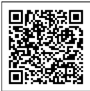
TABLA DE ALÉRGENOS