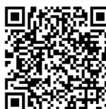
TABLA DE ALÉRGENOS